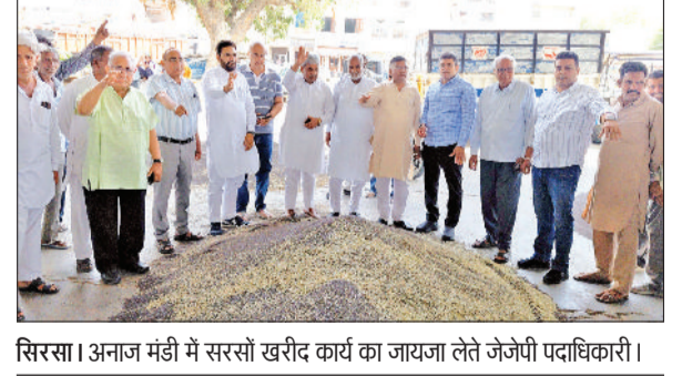
सिरसा। अनाज मंडी में सरसों खरीद कार्य का जायजा लेते जेजेपी पदाधिकारी।