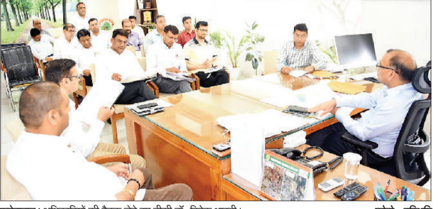
फतेहाबाद। अधिकारियों की बैठक लेते हुए डीसी डॉ. विवेक भारती।

व्यवस्था प्रबंधन के मद्देनजर जिले की सभी मंडियों व खरीद केंद्र पर व्यवस्था दुरुस्त