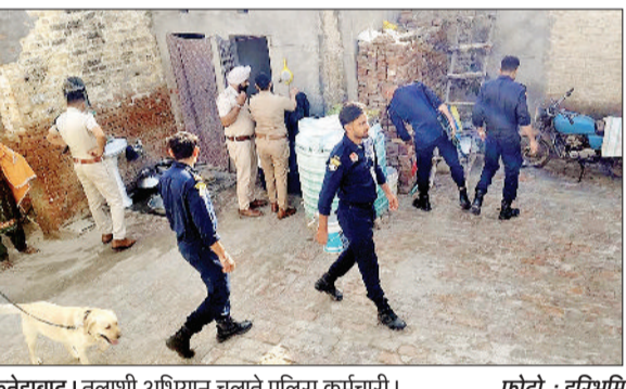
फतेहाबाद। तलाशी अभियान चलाते पुलिस कर्मचारी।

डॉग स्कॉड टीम, कमांडो टीम तथा स्थानीय पुलिस रही मौजूद