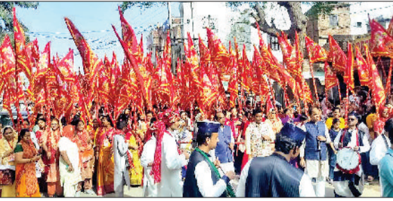
सिरसा। शोभायात्रा निकालते श्रद्धालु तथा झांकी निकालते कलाकार।

श्री हनुमान जन्मोत्सव के उपलक्ष्य में मंगलवार को शहर में बालाजी महाराज की भव्य शोभायात्रा का आयोजन किया गया, जिसमें बड़ी श्रद्धालुओं ने हिस्सा लिया। हाथों में भद्रावली के जयकारे लगा रहे थे। श्री सालासरधाम मंदिर केमटी की ओर से चार दिवसीय श्री हनुमान जन्मोत्सव के उपलक्ष्य में इस शोभायात्रा का आयोजन किया गया है। बेगू रोड पर महाराज अग्रसेन स्कूल से शोभायात्रा पूजा