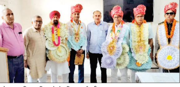
फतेहाबाद। जिला पुलिस से सेवानिवृत्त कर्मचारी।

सेवानिवृत्ति केवल एक प्रक्रिया, पुलिसकर्मों सदैव जनसेवा के लिए समर्पित रहता है : एसपी