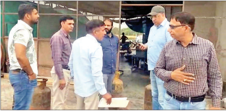
फतेहाबाद। होटलों, ढाबों इत्यादि का निरीक्षण करते हुए खाद्य आपूर्ति विभाग की टीमें।