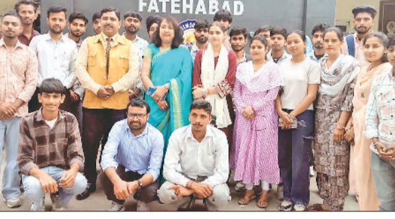
फतेहाबाद। कॉलेज पहुंचे मुख्य वक्ता का स्वागत करते स्टाफ सदस्य व विद्यार्थी।

विद्यार्थियों को डिजिटल युग के महत्वपूर्ण टूल्स के बारे में जानकारी दी